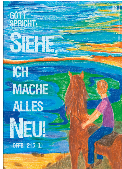
Motiv 11 „Sonnenaufgang“