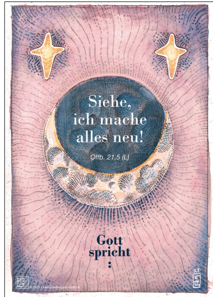
Motiv 1 „Luna“