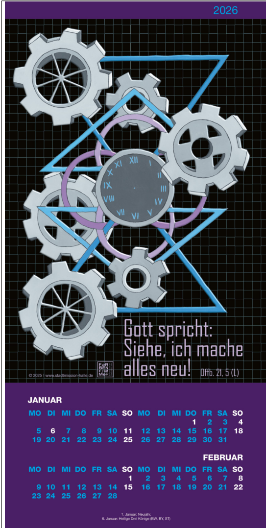
6-seitiger Kalender Enthaltene Motive: 12, 6, 9, 4, 5, 3

Die Künstlergruppe „Farbenflimmer“ der Evangelischen Stadtmission Halle hat sich dem Thema der Jahreslosung 2025 gewidmet und präsentiert ihre Plakate und Karten.