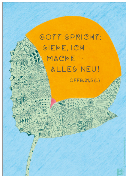
Motiv 2 „Knospe“