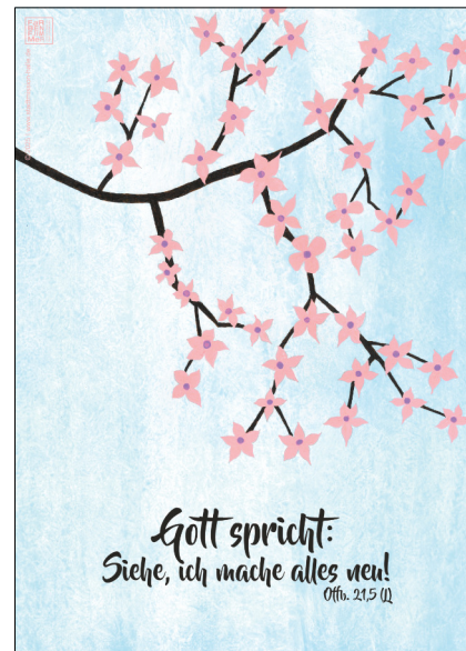
Motiv 8 „Blütenzweig“