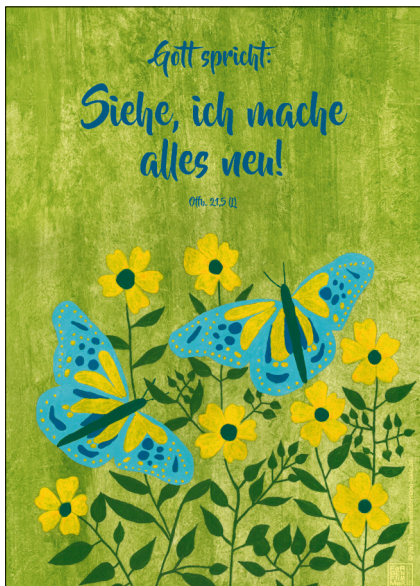
Motiv 6 „Schmetterlinge“