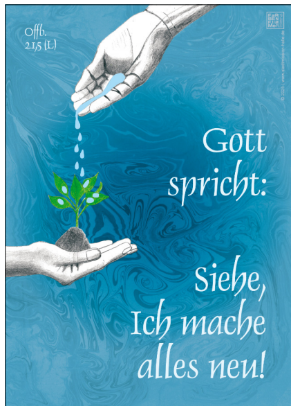
Motiv 4 „Hände Pflanze“