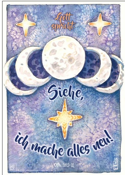
Motiv 3 „Selene“