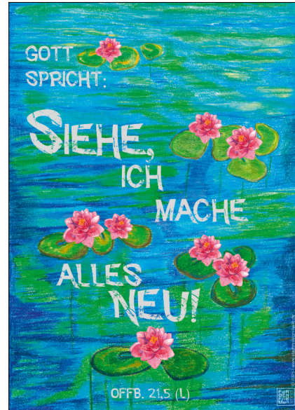
Motiv 9 „Seerosenteich“