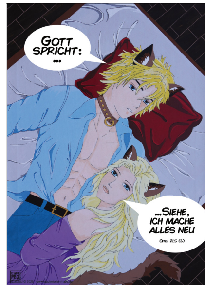
Motiv 10 „Zweisamkeit“