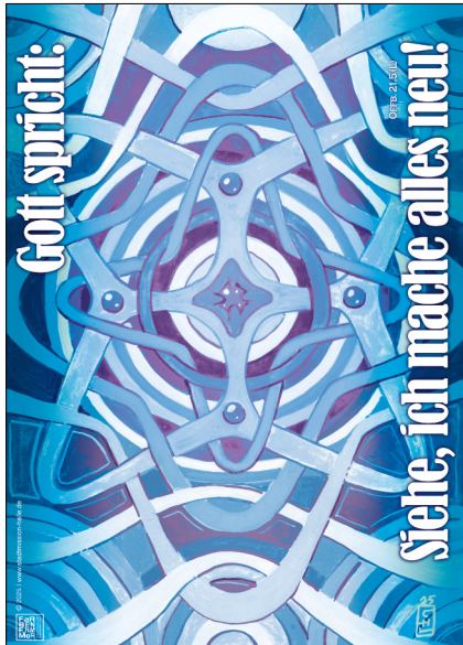
Motiv 5 „Vortex“