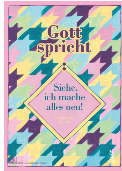
Motiv 7 „Vorwärts“