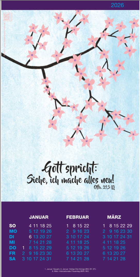
4-seitiger Kalender Enthaltene Motive: 8, 11, 10, 1